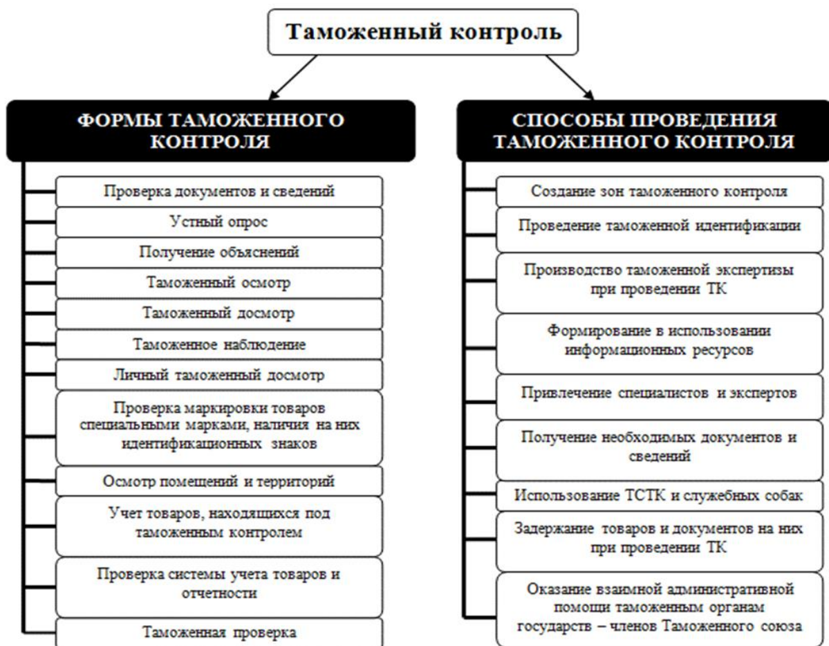
Рис. 1. Формы и способы проведения таможенного контроля в соответствии с ТК ТС.

Кроме того, в ТК ТС предусмотрены действия, применяемые таможенными органами для наиболее эффективной реализации избранной формы таможенного контроля, которые можно обозначить как способы проведения таможенного контроля.